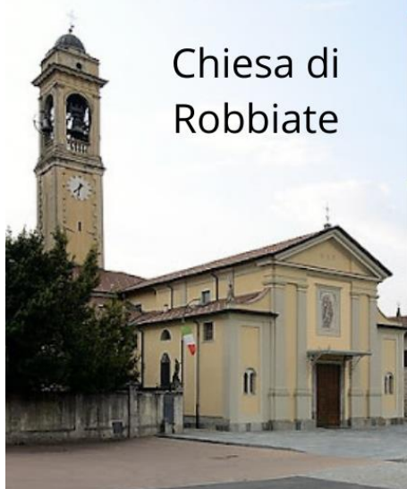
Chiesa di Robbiate

LE ISCRIZIONI SI RICEVONO IN SEGRETERIA PARROCCHIALE IN ORARI DI APERTURA POSTI LIMITATI